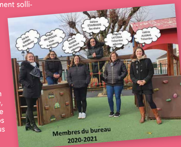
Membres du bureau 2020-2021