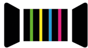
La Bobine à Rayures

L'exaltation autour d'une création est souvent de rigueur et nous cousons de concert avec entrain. Collaboration et entraide sont les maîtres-mots à la Bobine ! Les seuls prérequis pour nous rejoindre sont l'envie, une once de débrouillardise et un petit grain de folie.