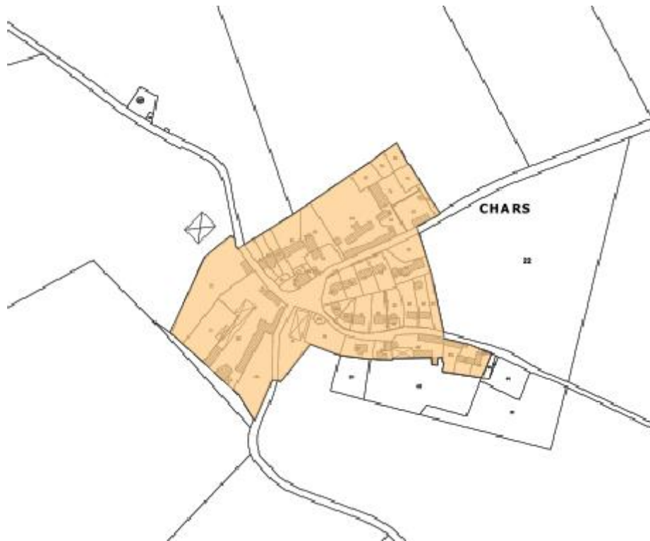
Figure 3 : Plan de zonage pluvial du hameau